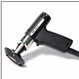
mit Pistole PCP 45-3 Massekabel (5 m) und speziell Magnetbolzenhalter