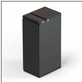
inklusive Akku GS 100 Der Akku kann über das Gerät aufgeladen werden